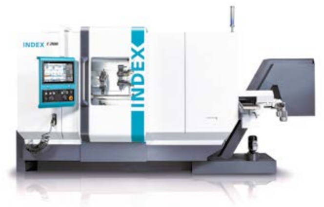
De C200 draaiautoomaten is een winnaar in het leveringsprogramma van Index. Hij wordt heel veel verkocht.