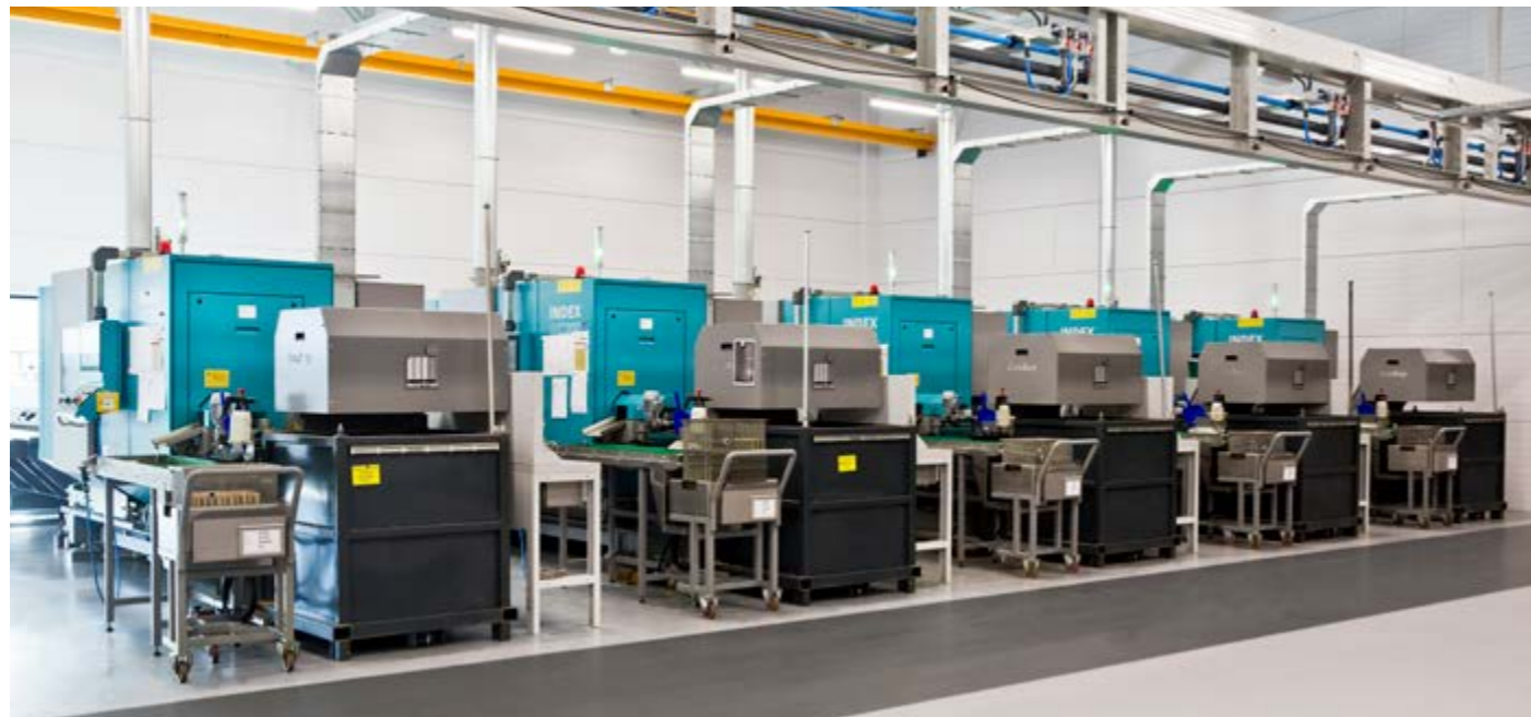
Bij VCN mass turning waren ze direct verliefd op de C200 draaiautomaten. Binnenkort worden opnieuw zeven machines van dit type aan het machinepark toegevoegd.

Vlak na de zomer gaat Laagland zeven C200 draaiautomaten van de nieuwste generatie van de Duitse machinefabrikant Index leveren aan VCN mass turning in Leek. Vooral de besturing van de C200 is verbeterd. Deze is niet alleen nog sneller en gebruiksvriendelijker geworden, er kunnen ook meer gegevens uit worden gehaald voor het maximaal uitnutten van het productieproces. En dat is precies het terrein waarop VCN de komende jaren veel winst denkt te boeken.