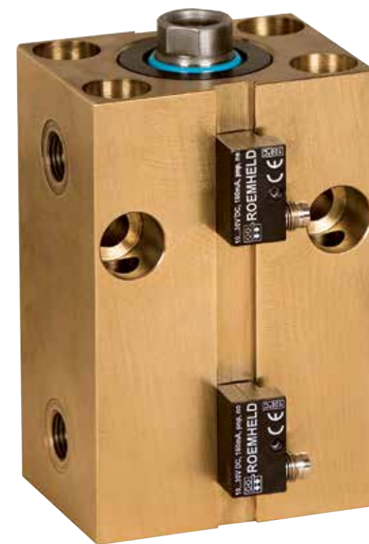
ROEMHELD biedt oplossingen aan op gebied van industriële productietechnologie, klemtechnologie, montagetechniek en aandrijftechniek.

'Met bijna twintig jaar ervaring met de ROEMHELD producten in Nederland, is Laagland de ideale partner voor Belgische bedrijven uit de metaalbewerkingssector'