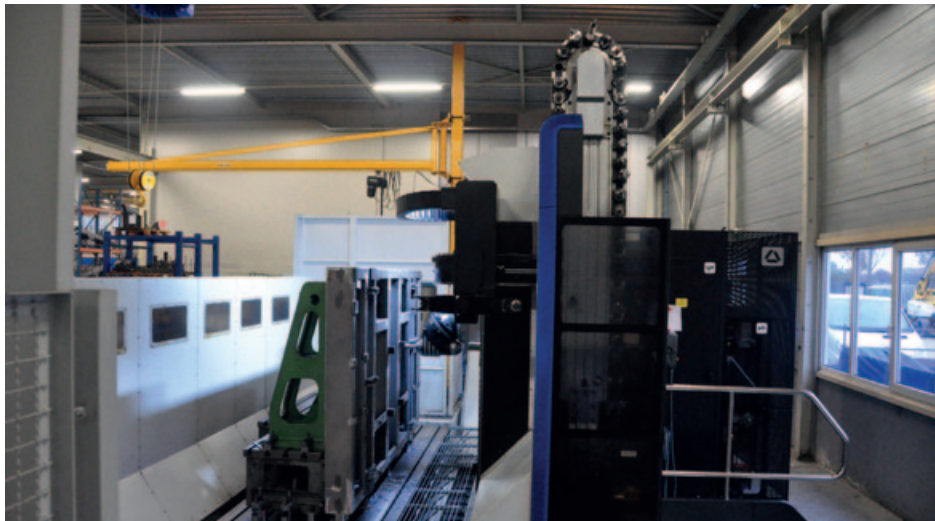
De Soraluce FLP 6000, de 'kleine broer', in vol bedrijf.