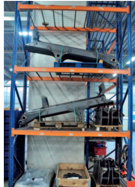
Grote lasdelen zoals Veldman die produceert.